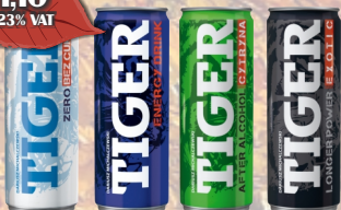
NAPÓJ TIGER 0,25L PUSZKA SUPER CENA!