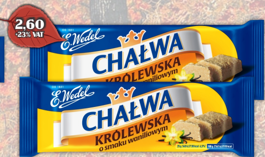
CHAŁWA 50G (BAKALIOWA, ORZECHOWA, WANILIOWA)