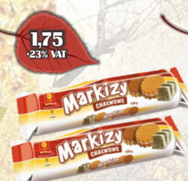
MARKIZY CIAŁWOWE 150G