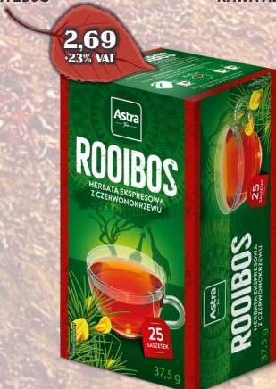
HERBATA ROOIBOS EX.25SZT MIX