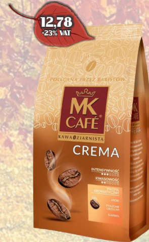
KAWA MK CREMA 500G ZIARNO