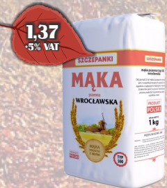
MAKA WROCLAWSKA 1KG