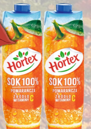
SOK POMARAŃCZOWY 1L