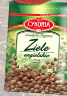
ZIELE ANGIELSKIE 20G