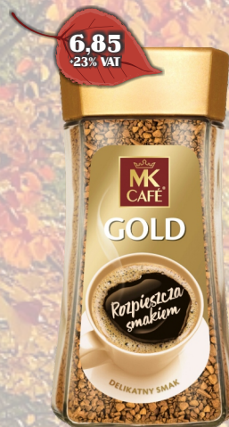
KAWA MK GOLD 75G INSTANT