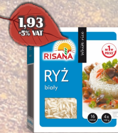
RYŻ BIAŁY RISANA 4x100G