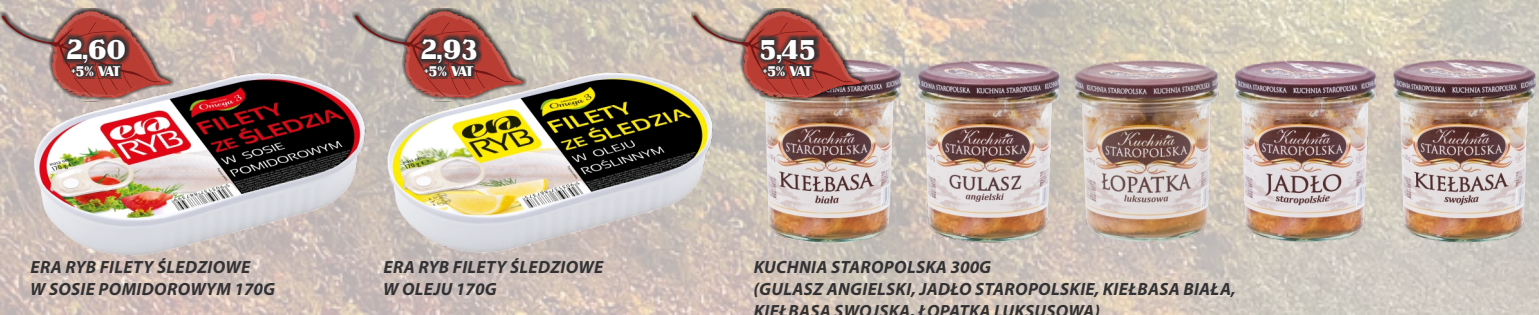
ERA RYB FILETY ŚLEDZIOWE W SOSIE POMIDOROWYM 170G