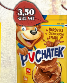
KAKAO PUCHATEK 150G