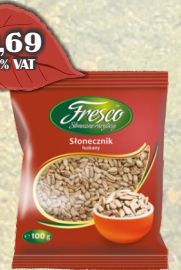
SŁONECZNIK 100G FRESCO