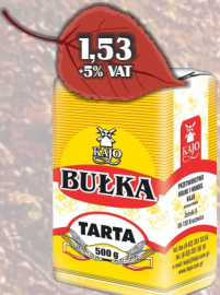
BUŁKA TARTA 500G