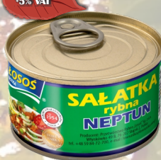
SALATKA RYBNA NEPTUN 170G