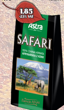
HERBATA SAFARI 100G