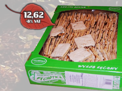
CIASTKO JAGODA LUZ