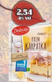
KREM KARPATKA 250G DELECTA