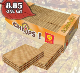
WAFLE CHRUPS KAKAOWE LUZ