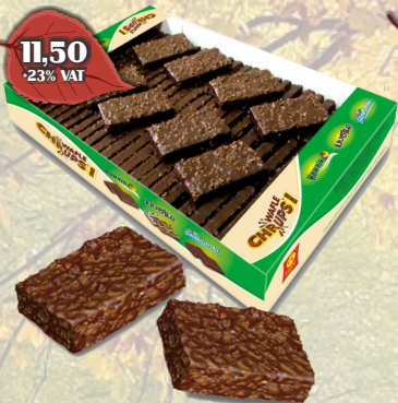
WAFLE HAWAJKI LUZ