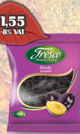
ŚLIWKA KALIFORNIJSKA 100G FRESCO