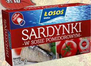
SARDYNKI W SOSIE POMIDOROWYM 125G