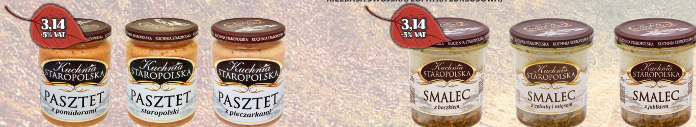
KUCHNIA STAROPOLSKA PASZTET 500G MIX