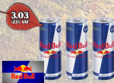
NAPÓJ RED BULL 250ml PUSZKA