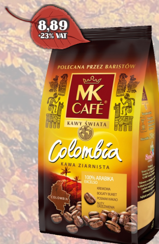
KAWA MK KOLUMBIA 250G ZIARNO