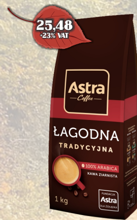
KAWA ASTRA TRADYCYJNA 1KG ZIARNO