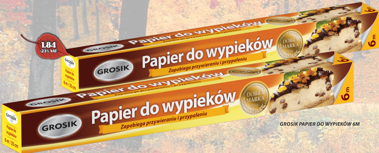
GROSİK PAPIER DO WYPIEKÓW 6M