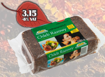
CHLEB RAZOWY 500G