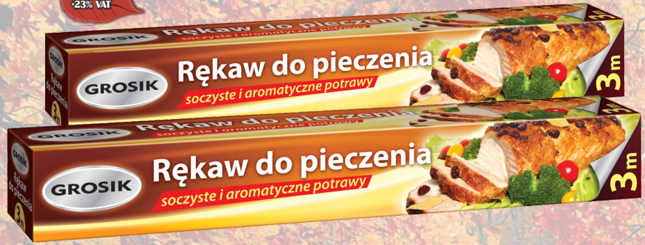
GROSİK RĘKAW DO PIECZENIA 3M