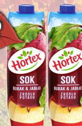
BARSZCZYK CZERWONY 1L