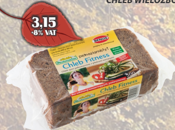
CHLEB FITNESS 500G