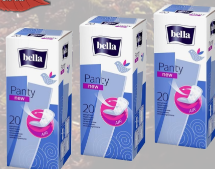
WKŁADKI PANTY NEW A'20