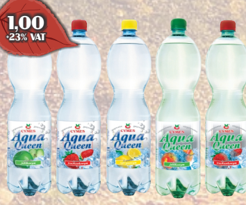
WODA AQUA QUEN 1,5L ASORTYMENT