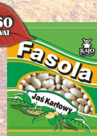
FASOLA BIAŁY JAŚ 400G