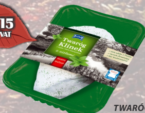
TWARÓG KLINEK TĘSTY Z ZIOŁAMI TACKA LUZ