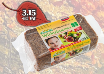
CHLEB WIELOŻBOŻOWY 500G