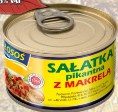
SALATKA PIKANTNA Z MAKRELĄ 170G