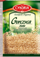
GORCZYCA BIALA 25G