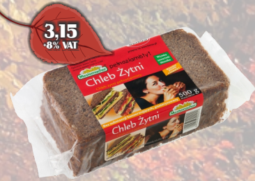
CHLEB ŻYJNI 500G