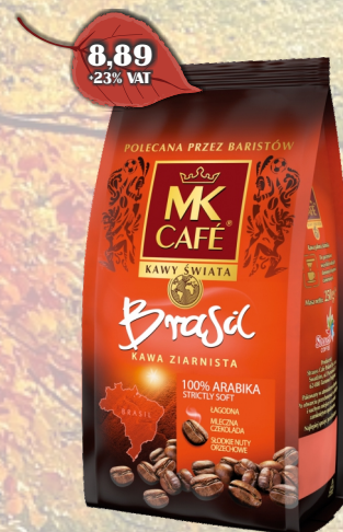
KAWA MK BRAZYLIA 250G ZIARNO