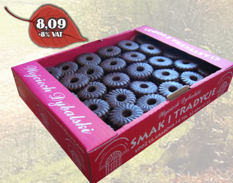
REGIONALNE W CZEKOLADZIE LUZ