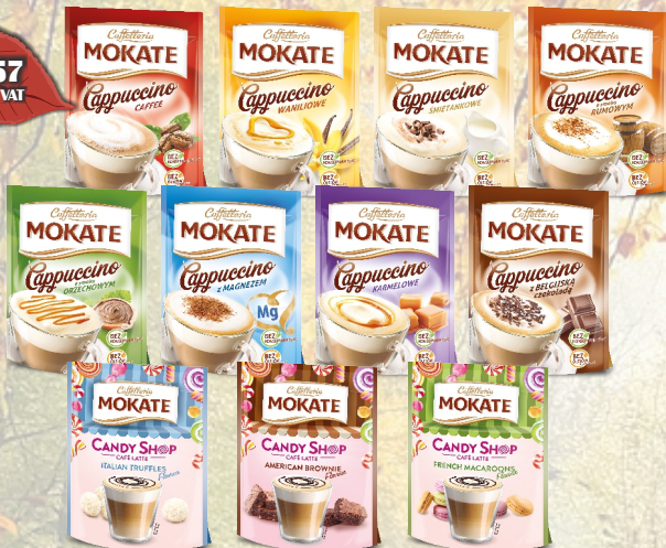
CAPPUCCINO 110G TOREBKA