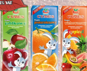
NAPÓJ MIX 0,2Lx27SZT