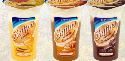
DESER SATINO 170G