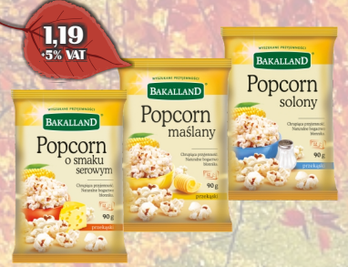
POPCORN 90G ASORTYMENT BAKALLAND