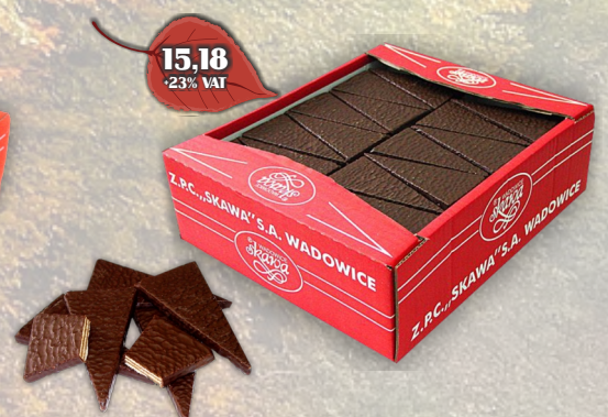
WAFLE TRÓJKĄT LUZ