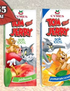
SOK TOM & JERRY 0,2Lx27SZT