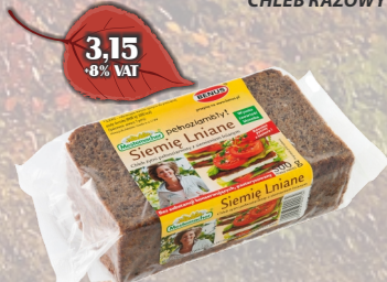
CHLEB Z SIEMIEM LNIANYM 500G