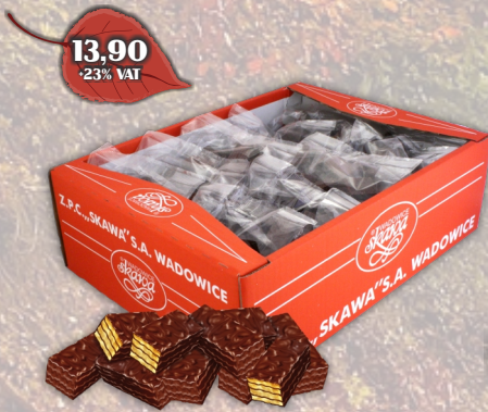
WAFLE MINI W CZEKOLADZIE LUZ