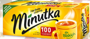
HERBATA MINUTKA EX. 100SZT