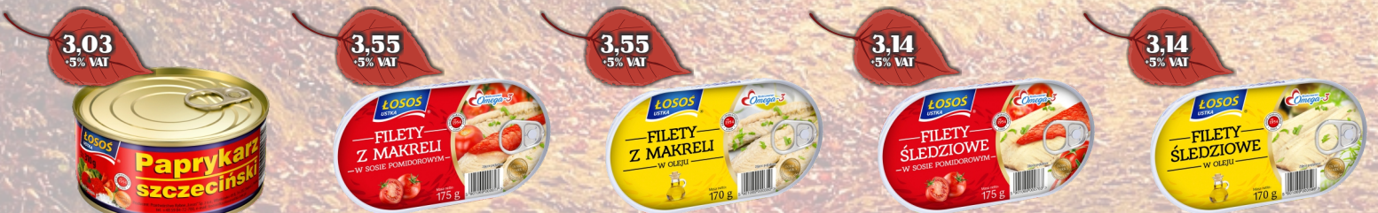
PAPRYKARZ SZCZECIŃSKI 310G