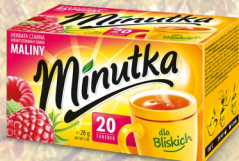
HERBATA MINUTKA EX. 20SZT