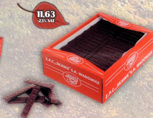
WAFLE ARABELKA LUZ