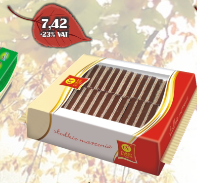
CHRUPS MUŚNIĘTY 620G