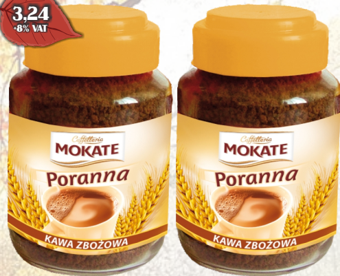
KAWA PORANNA ZBOZOWA 100G