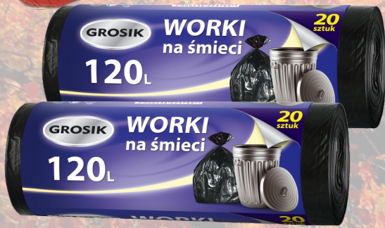
GROSİK WORKI HD CZARNE 120L 20SZT