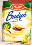
BUDYNIE 40G MIX