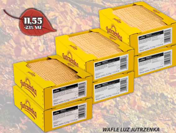
WAFLE LUZ JUTRZENKA