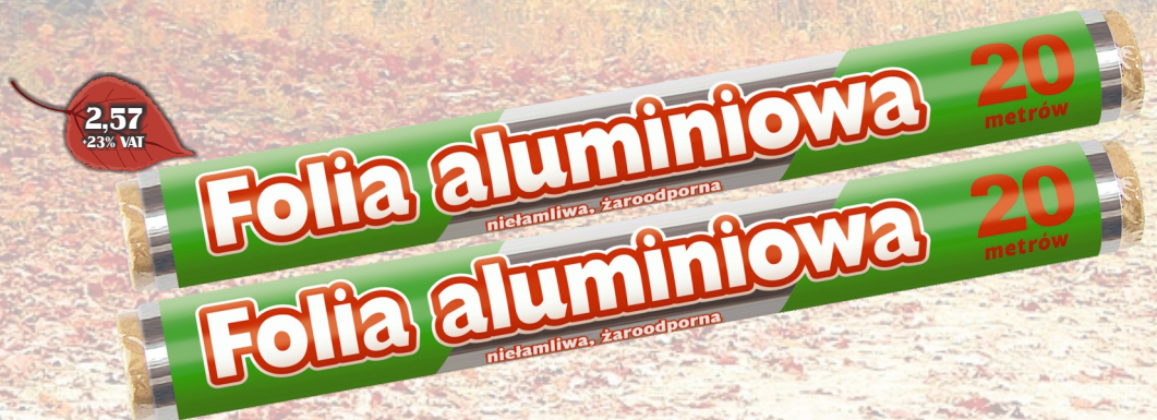
NN FOLIA ALUMINIOWA 20M