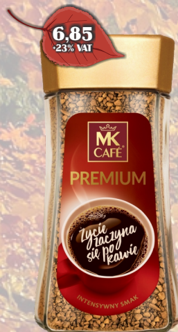
KAWA MK PREMIUM 75G INSTANT