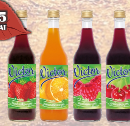
SYROP VICTOR 500ml ASORTYMENT

Ceny gotówkowe (odbior własny). Przy terminie 1% drożej, dostawa towaru 2% drożej.