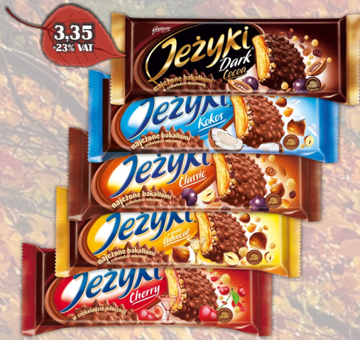
JEZYKI 140G ASORTYMENT