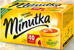
HERBATA MINUTKA EX. 40SZT