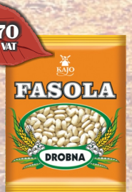
FASOLA DROBNA 400G

Ceny gotówkowe (odbiór własny). Przy terminie 1% drożej, dostawa towaru 2% drożej.