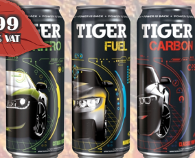
NAPÓJ TIGER 500ml PUSZKA