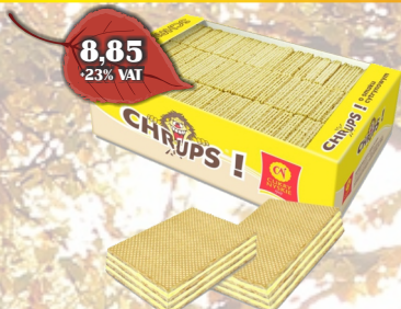
WAFLE CHRUPS CYTRYNA LUZ