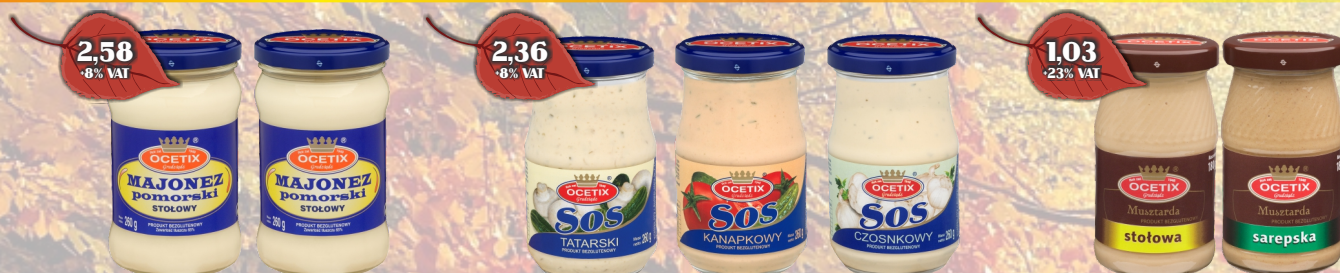
MAJONEZ POMORSKI 260G