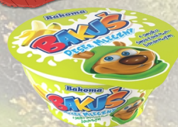
DESER BAKUŚ 100G