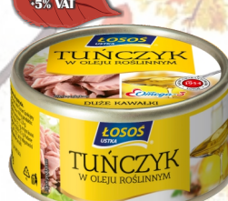
TUŃCZYK W OLEJU 170G