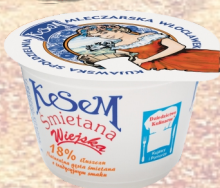
ŚMIETANA WIEJSKA 18% 200G