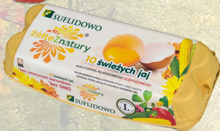
JAJKA ŚWIEŻE 10SZT