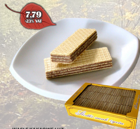
WAFLE KAKAOWE LUZ