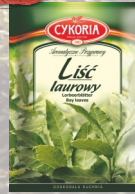
LISEC LAUROWY 12G