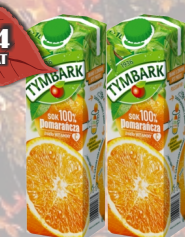
SOK POMARAŃCZOWY 1L