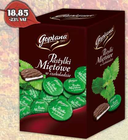
PASTYLKI MIĘTOWE W CZEKOLADZIE LUZ