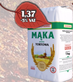
MAKA TORTOWA 1KG