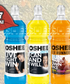
OSHEE ISOTONIC DRINK 750ml