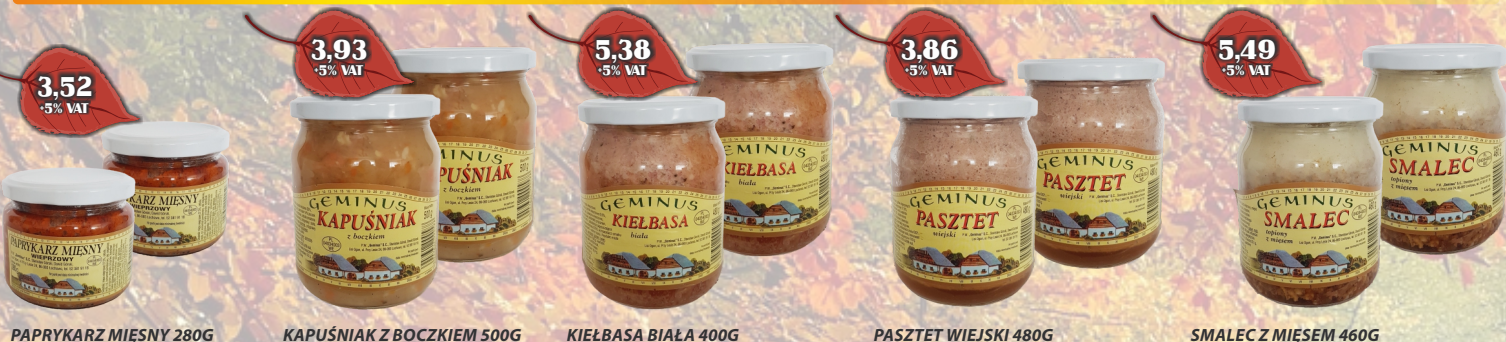
PAPRYKARZ MIĘŚNY 280G