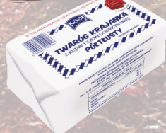
TWARÓG KRAJANKA PÓŁTĘSTY Z KUJAW LUZ