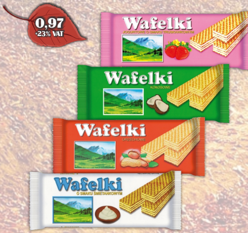
WAFELKI 80G ASORTYMENT