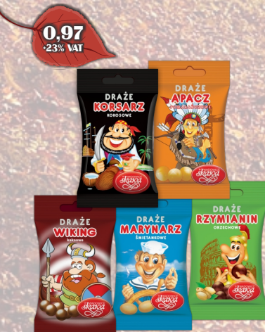
DRAŻE 70G ASORTYMENT