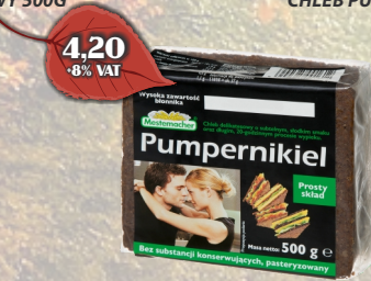
CHLEB PUMPERNIKIEL 500G NOWOŚĆ!