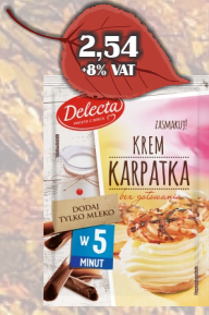
KREM KARPATKA W 5 MIN 145G DELECTA