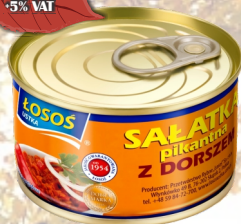
SALATKA PIKANTNA Z DORSZEM 170G