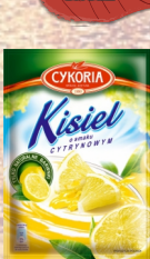
KISIELE 40G MIX