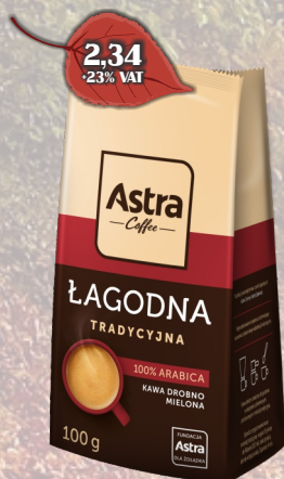
KAWA ASTRA TRADYCYJNA 100G