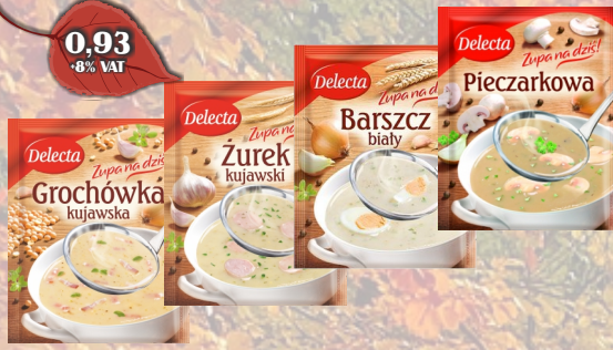
ZUPY ASORTYMENT DELECTA