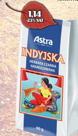
HERBATA INDIA 90G