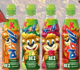
NAPÓJ KUBAŚ PLAY 0,4L Przy zakupie całej zgrzewki płacisz za 10 sztuk!