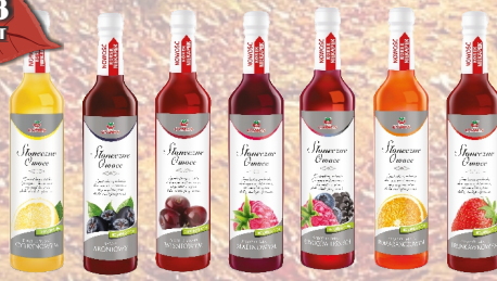
SYROP SŁONECZNE OWOCE 430ml ASORTYMENT