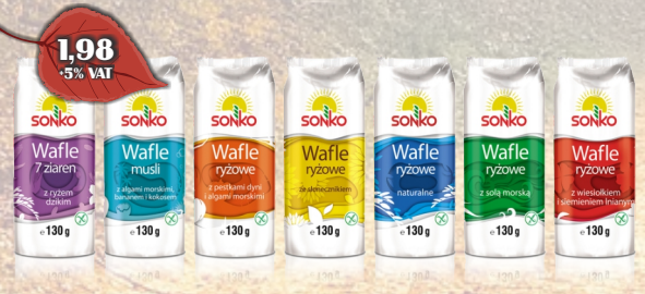
WAFLE RYZOWE 130G ASORTYMENT