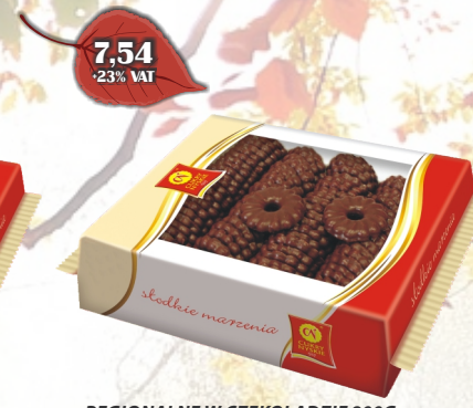
REGIONALNE W CZEKOLADZIE 800G