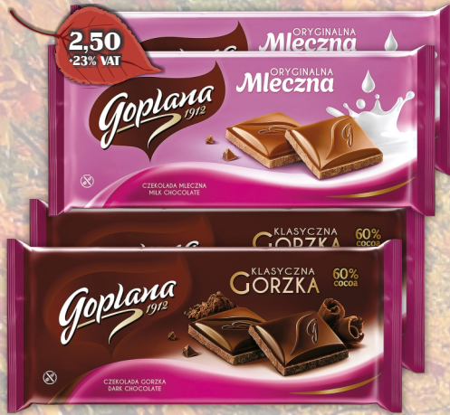
CZEKOLADA GOPLANA 90G (GORZKA, MLECZNA)