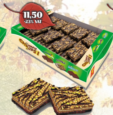
WAFLE NUBILE LUZ