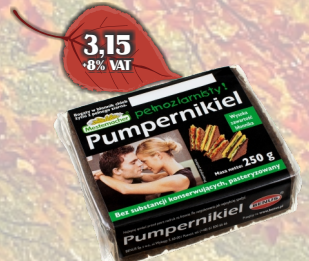
CHLEB PUMPERNIKIEL 250G