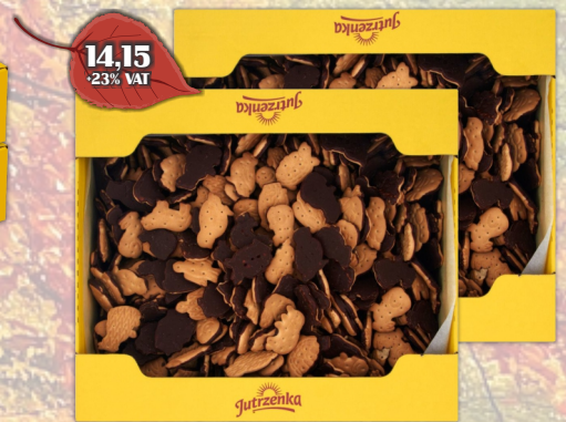
ZWIERZAKI W CZEKOLADZIE LUZ