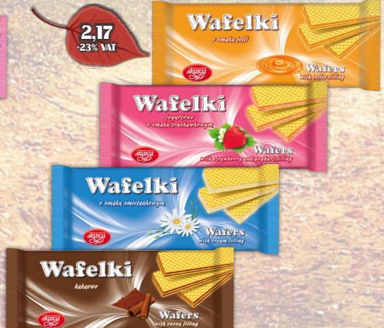
WAFLE 180G ASORTYMENT