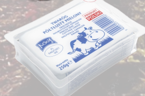
TWARÓG PÓŁTĘSTY MIELONY 250G