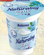
JOGURT NATURALNY 150G