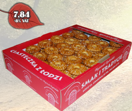
REGIONALNE W CUKRZE LUZ