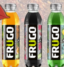
FRUGO 500ML PET