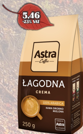
KAWA ASTRA CREMA 250G