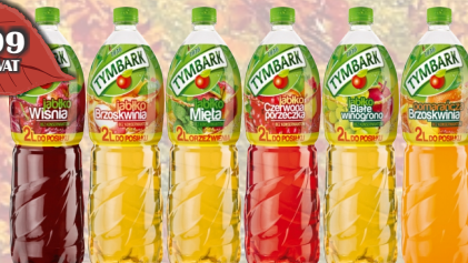
NAPÓJ ASEPTIC 2L