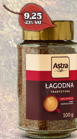
KAWA ASTRA 100G SŁOIK