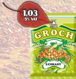
GROCH ŁUSKANY POŁÓWKI 400G