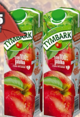
SOK JABŁKOWY 1L