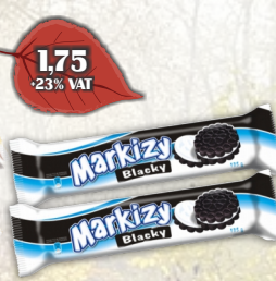
MARKIZY BLACK 135G