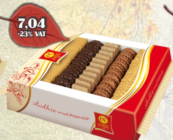
MIESZANKA FAMILIJNA 710G