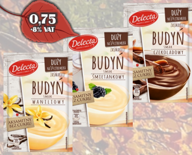
BUDYN 64G ASORTYMENT DELECTA