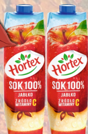
SOK JABŁKOWY 1L