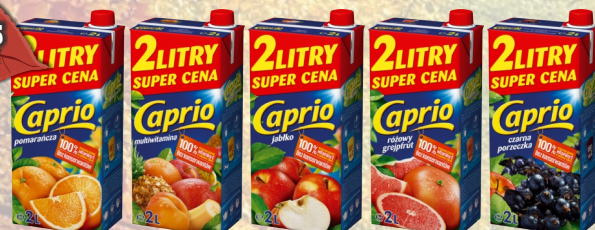
CAPRIO 2L KARTON