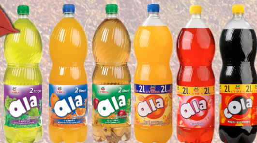
NAPÓJ ALA 2L ASORTYMENT