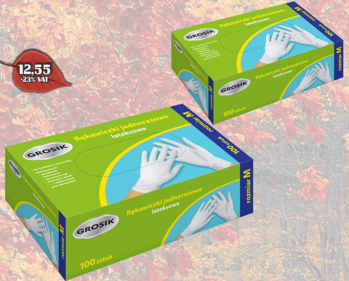
GROSİK RĘKAWICZKI LATEKSOWE 100SZT