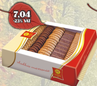
MIESZANKA LETNIA 670G