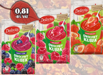
OWOOCOWY KUBEK 30G ASORTYMENT DELECTA