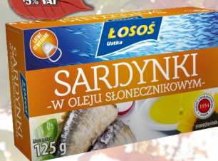
SARDYNKI W OLEJU SŁONECZNIKOWYM 125G