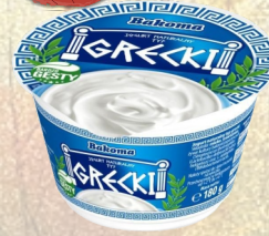
JOGURT GRECKI 180G