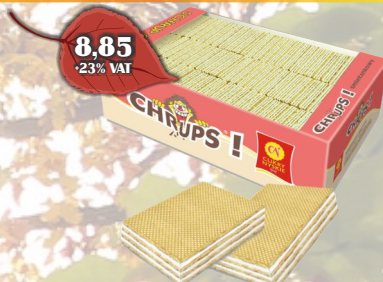
WAFLE CHRUPS ŚMIETANKOWE LUZ