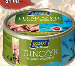
TUŃCZYK W SOSIE WŁASNYM 170G