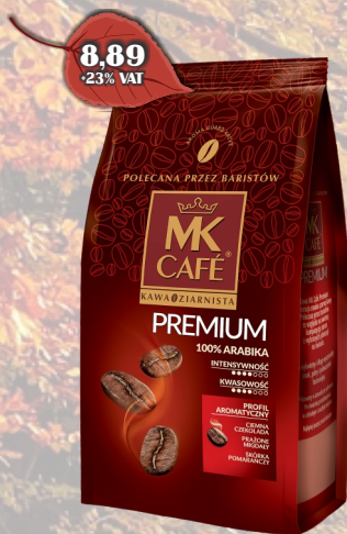
KAWA MK PREMIUM 250G ZIARNO