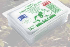
TWARÓG ŚMIETANKOWY MIELONY 250G