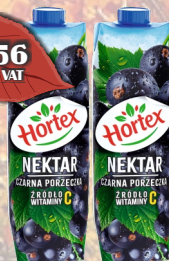
NEKTAR CZARNA PORZECZKA 1L