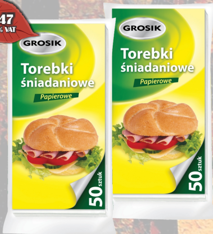
GROSİK TOREBKI ŚNIADANIOWE PAPIEROWE 50SZT