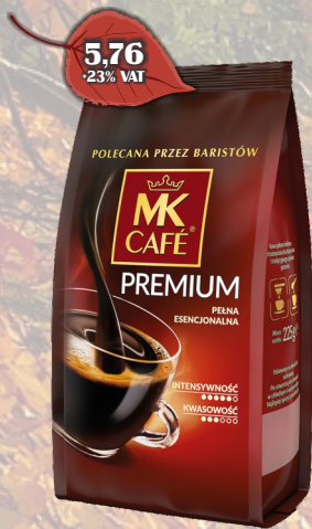
KAWA MK PREMIUM 225G