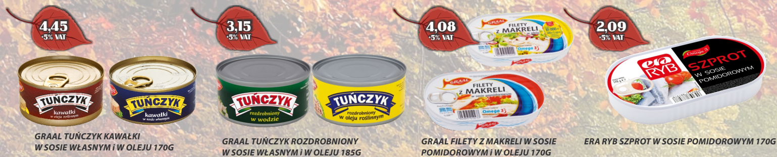
GRAAL TUŃCZYK KAWALKI W SOSIE WŁASNYM I W OLEJU 170G